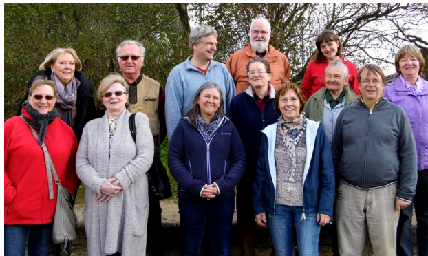
Freundeskreis im April 2016

Alles was Du an Gutem einbringst, kommt zu Dir in einer anderen Form wieder zurück! Gute Werke „kreisen“ in unserem Kreis!